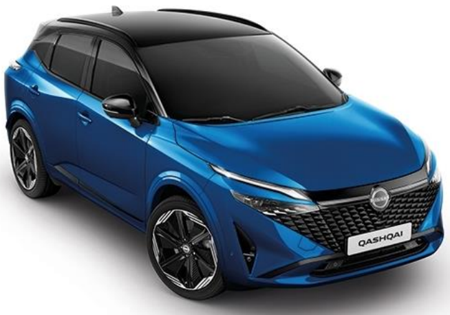
Лазурний перламутр + дах чорного кольору - XGZ