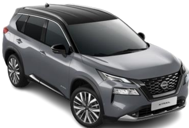
Сірий перламутр з чорним дахом – XEX

Двоколірний кузов (основний колір – преміум/перламутр): +40 130 грн (включно з вартістю фарби преміум/перламутр)