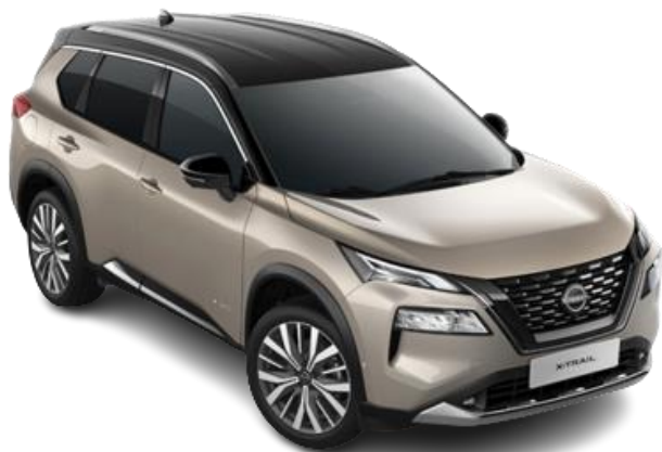
Срібло шампань з чорним дахом – XEW

Двоколірний кузов (основний колір – металік): +30 480 грн