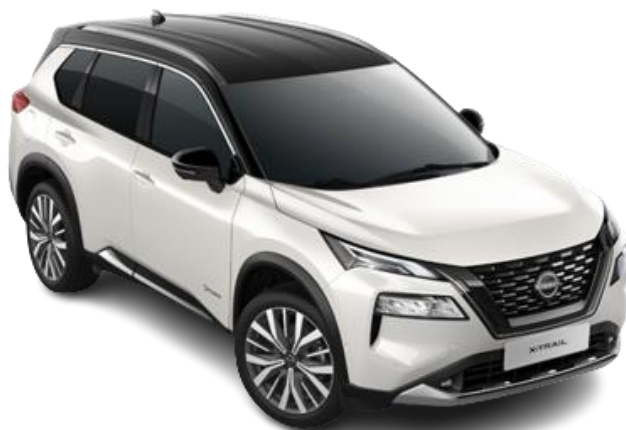
Білий перламутр з чорним дахом – XKJ