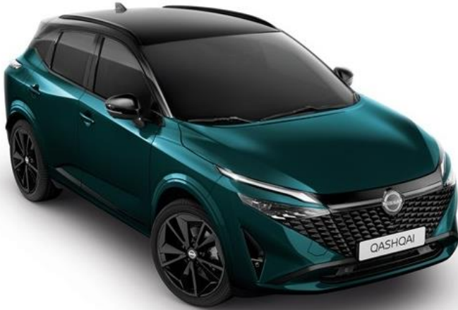
Синьо-зелений преміум + дах чорного кольору - YBJ

Текна: +38 250 грн (включно з вартістю фарби преміум/перламутр) N-Design / Текна+: стандартне обладнання