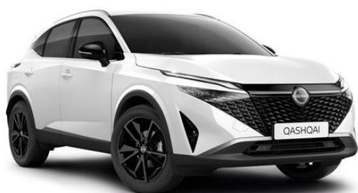
Перлинно-білий - QBE