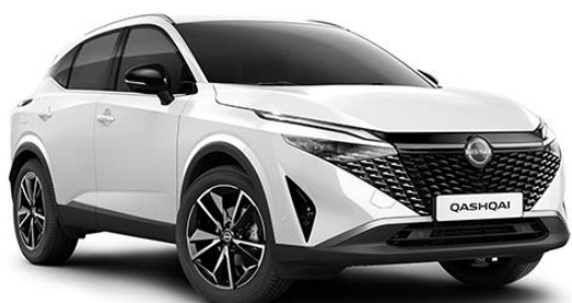
Перлинно-білий – QBE