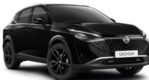
Чорний перламутр - GAT