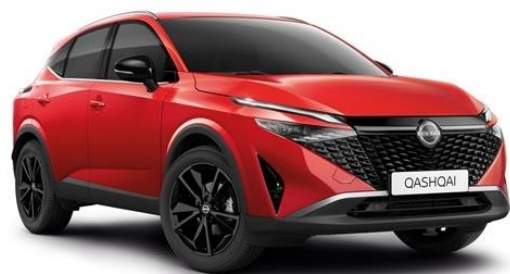
Червоний Fuji Sunset - NBV