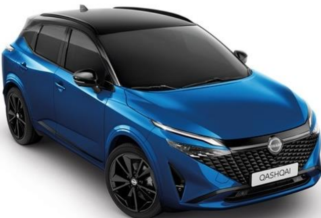
Лазурний перламутр + дах чорного кольору - XGZ