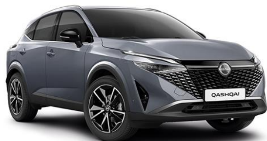
Сірий перламутр – KBV