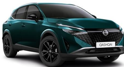
Синьо-зелений преміум - FAP