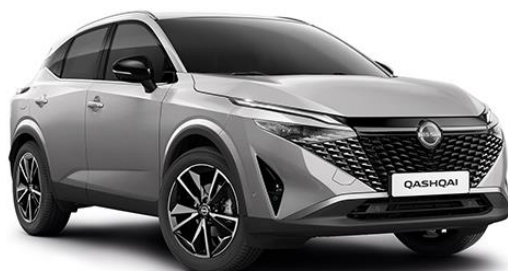
Сріблястий – KYO