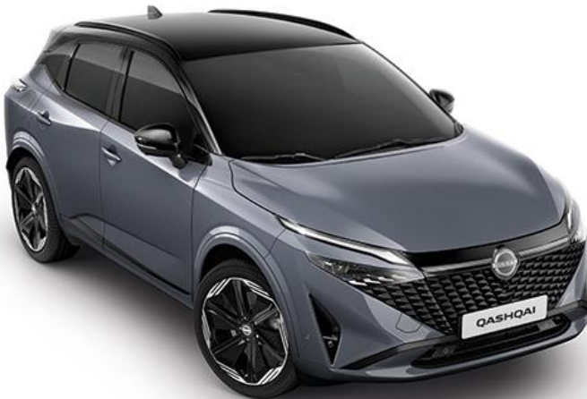
Сірий перламутр + дах чорного кольору - XEX