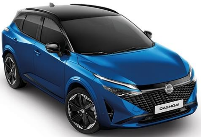
Лазурний перламутр + дах чорного кольору - XGZ