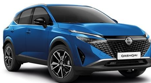
Лазурний перламутр – RCF