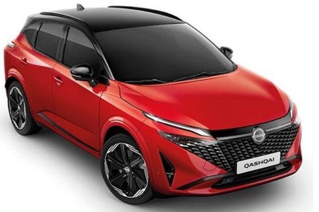
Червоний Fuji Sunset + дах чорного кольору - YAU