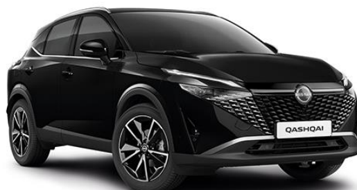
Чорний перламутр – GAT