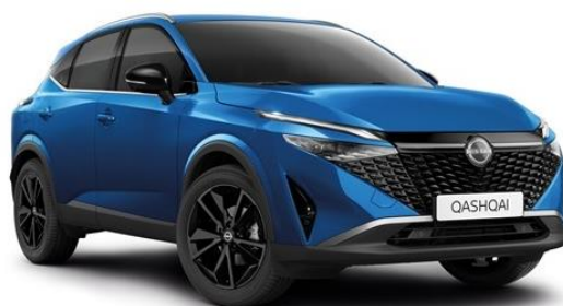
Лазурний перламутр - RCF