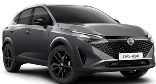
Темно-сірий - KAD