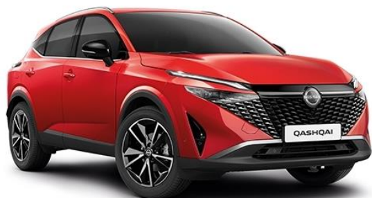
Червоний Fuji Sunset – NBV