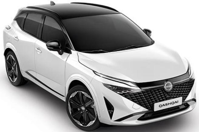
Перлинно-білий + дах чорного кольору - XKJ