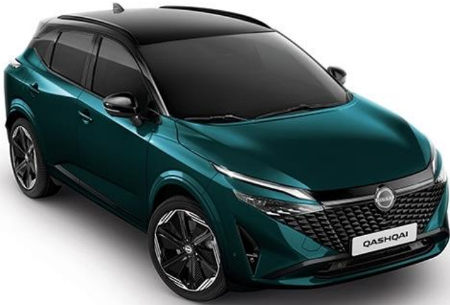
Синьо-зелений преміум + дах чорного кольору - YBJ

Текна: +37 690 грн (включно з вартістю фарби преміум/перламутр) N-Design / Текна+ : стандартне обладнання