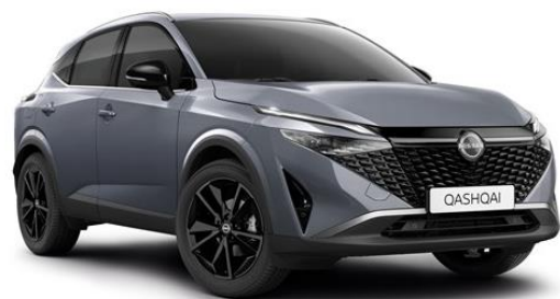
Сірий перламутр - KBY