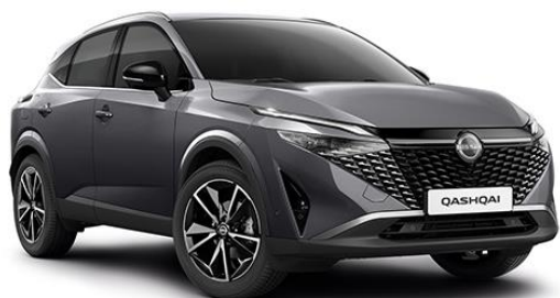
Темно-сірий – KAD