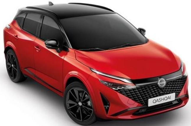
Червоний Fuji Sunset + дах чорного кольору - YAU