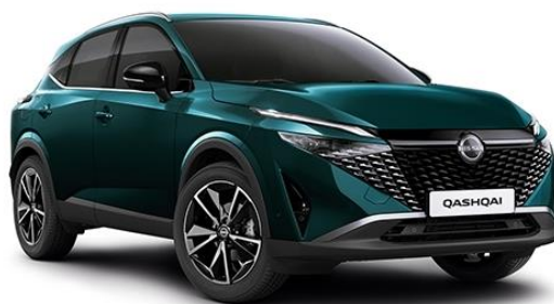
Синьо-зелений преміум – FAP